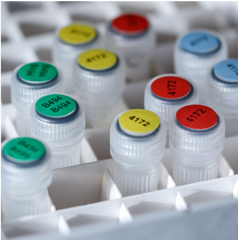
Label B-494-brady-thermisch transfer-bedrukbaar-kleur