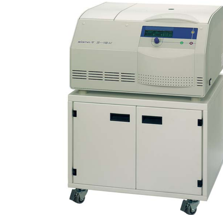
No. 17918 (3-18K) Fahrbarer Untertisch mit 2 Türen und feststellbaren Rollen. (B x H x T, 690 x 497 x 635 mm) Table with 2 doors and lockable castors. (W x H x D, 690 x 497 x 635 mm) No. 17919 (3-18) (B x H x T, 571 x 515 x 635 mm) (W x H x D, 571 x 515 x 635 mm)